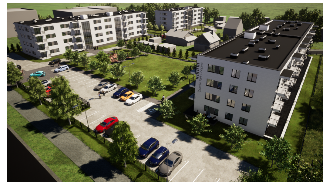
LOKALIZACJA W BUDYNKU