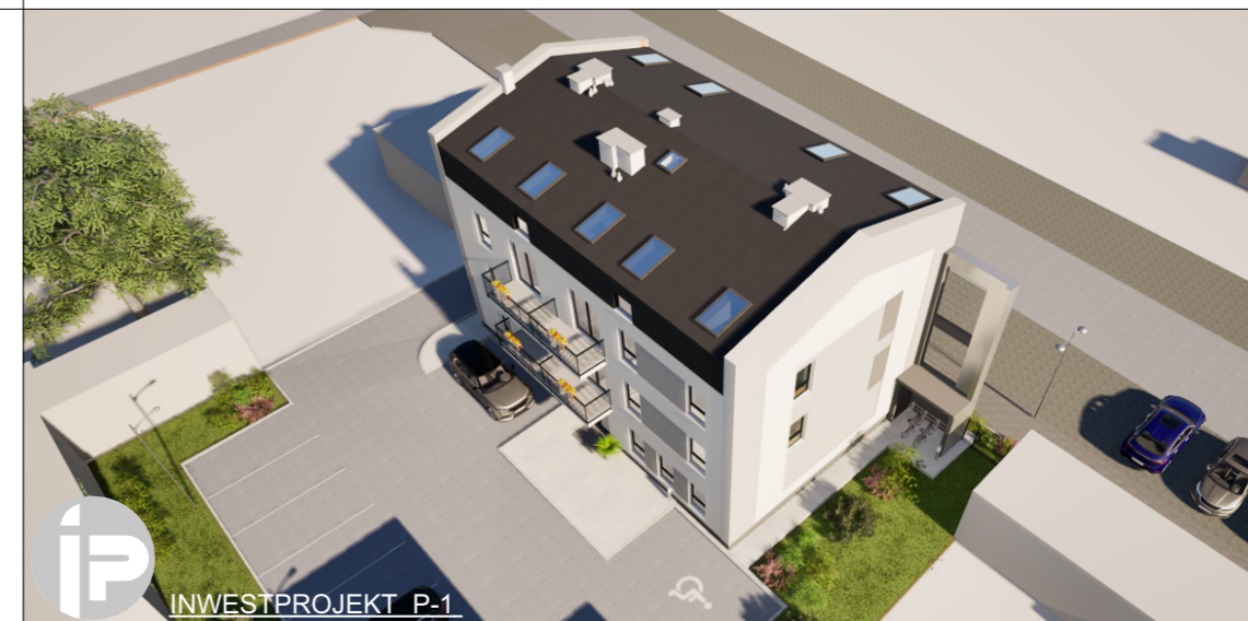
LOKALIZACJA MIESZKANIA W BUDYNKU